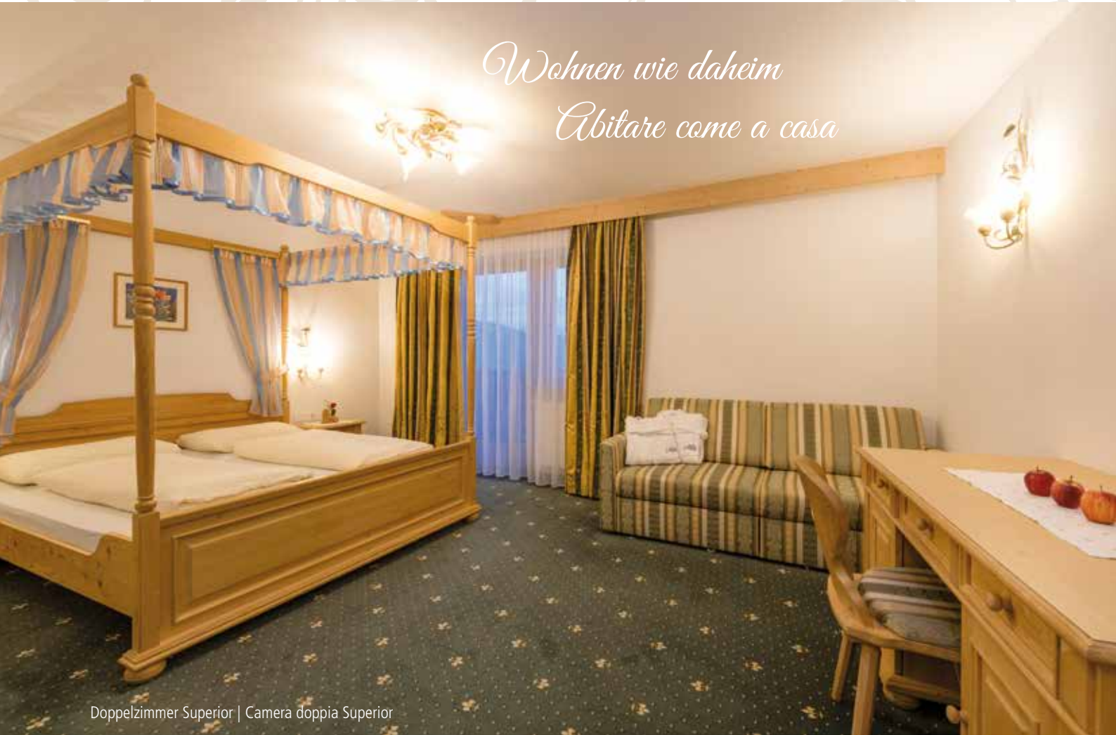
Doppelzimmer Superior | Camera doppia Superior

Unsere Gästezimmer und komfortablen Suiten sind mit Dusche, WC, Fön, Safe, TV und teilweise mit Balkon ausgestattet. Helle und großzügige Räumlichkeiten sorgen für bestes Wohlbefinden.