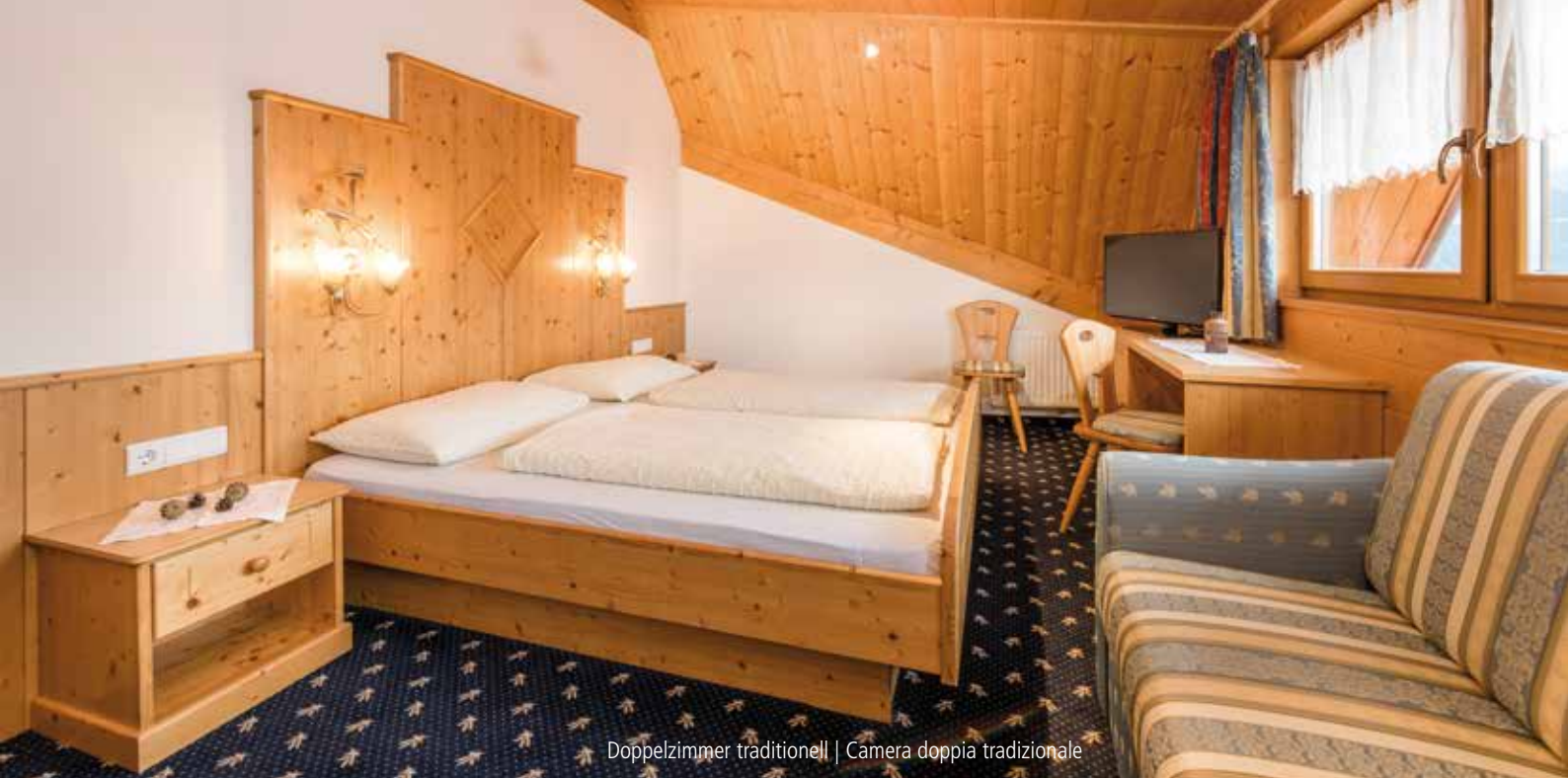
Doppelzimmer traditionell | Camera doppia tradizionale