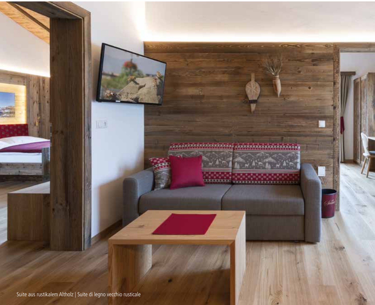
Suite aus rustikalem Altholz | Suite di legno vecchio rusticale