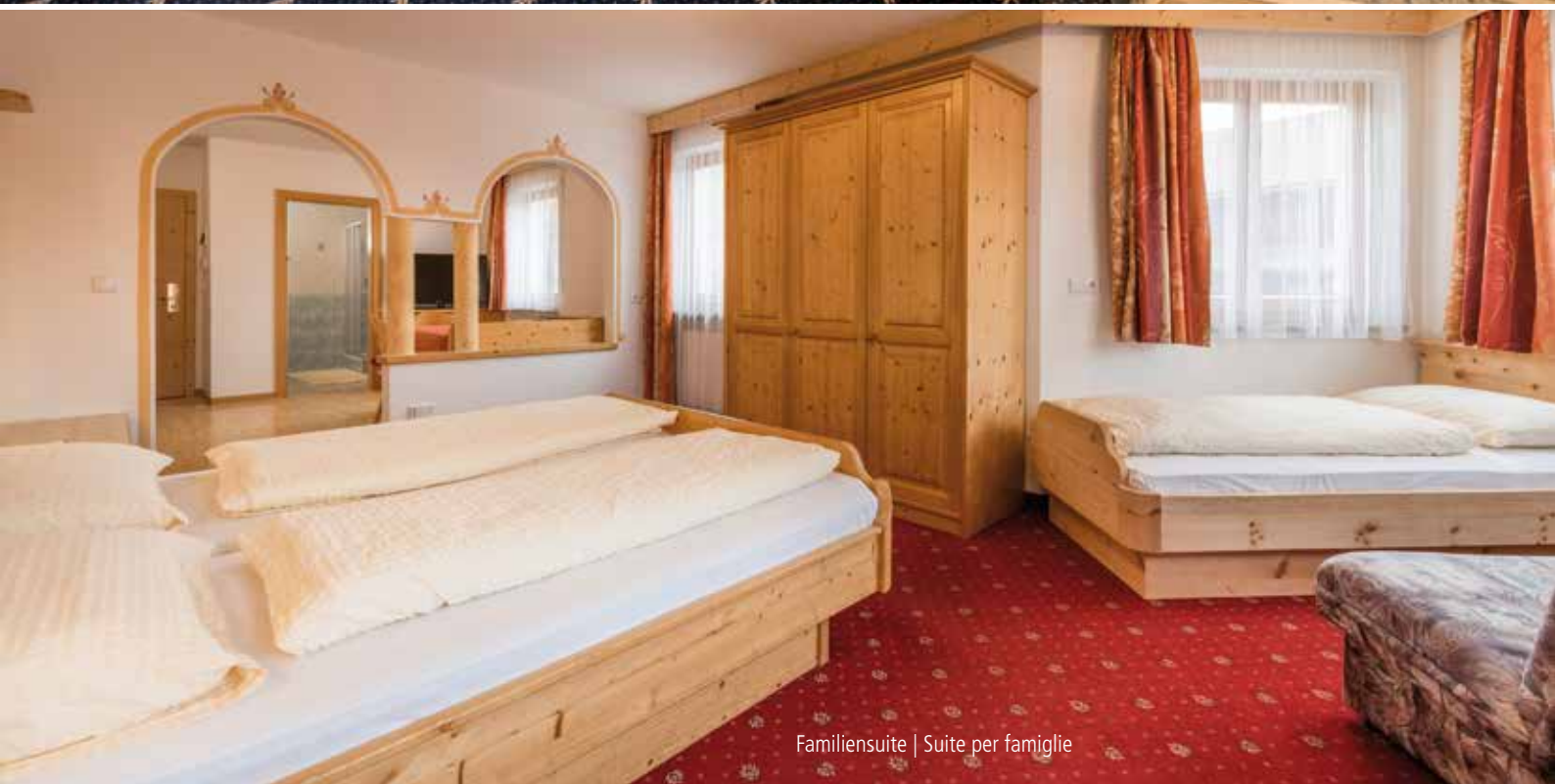
Familiensuite | Suite per famiglie