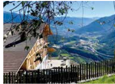
NOSTRO MASO „HINTERLEITNER“