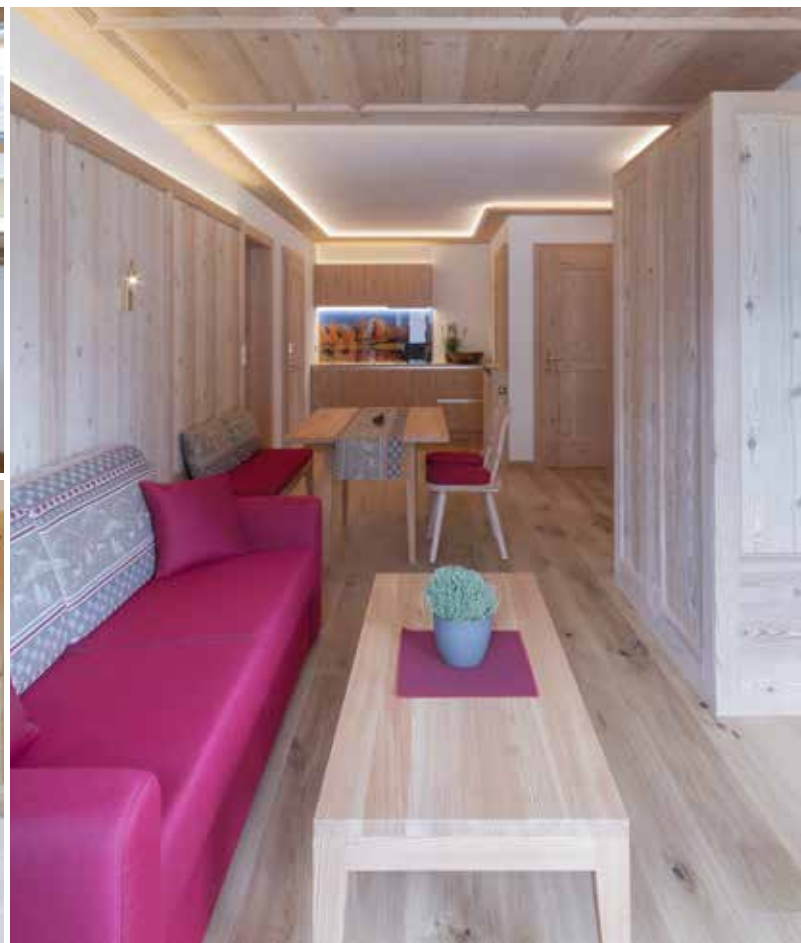
Suite familiari moderne e spaziose fatte in legno di cirmolo, larice, abete rosso e in legno rusticale.