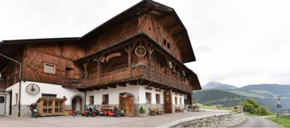
NOSTRA FATTORIA CON MINIZOO